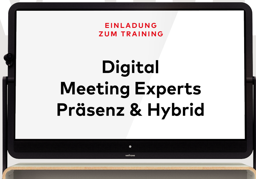
Ein weframe-Training der Stufe